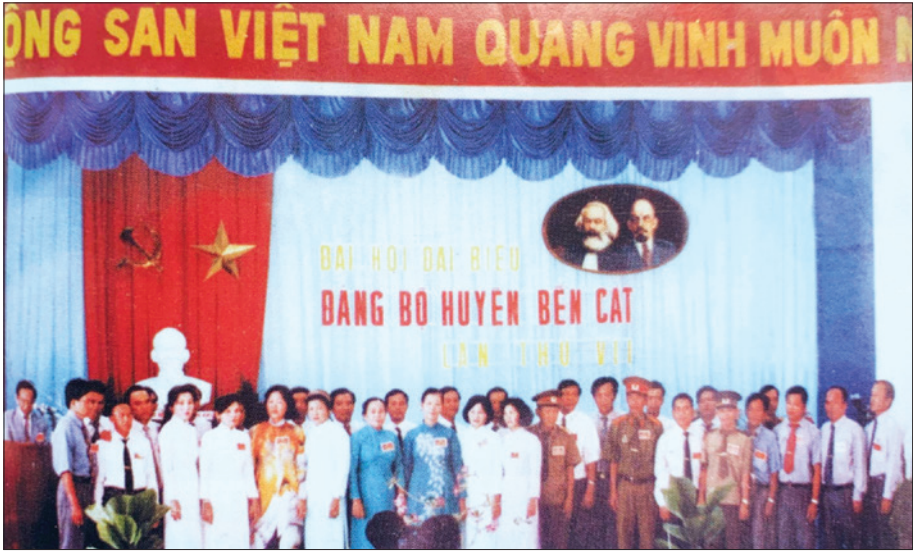
Đại hội đại biểu Đảng bộ huyện Bến Cát lần thứ VII (nhiệm kỳ 1996 - 2000)