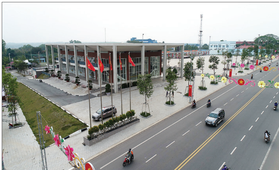
Trung tâm Hội nghị triển lãm thị xã Bến Cát (được khánh thành và đưa vào hoạt động năm 2015)