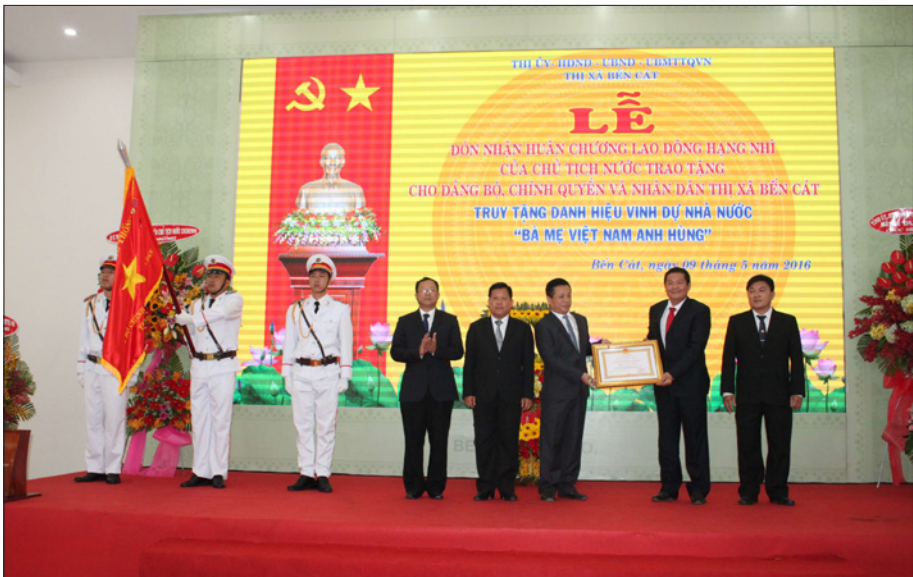
Thị xã Bến Cát được Chủ tịch nước tặng Huân chương Lao động hạng Nhì năm 2016