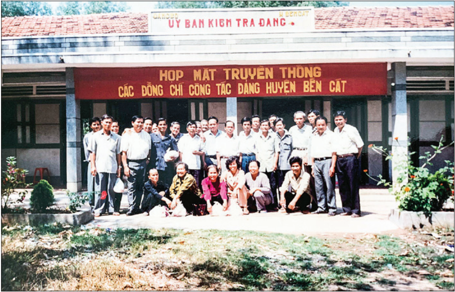
Các đồng chí công tác Đảng huyện Bến Cát họp mặt truyền thống