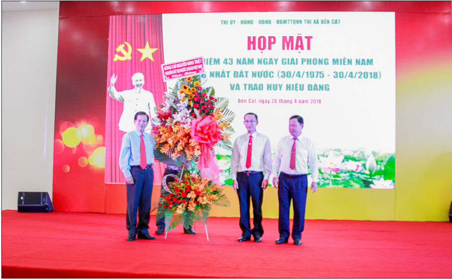
Nguyên Chủ tịch nước Nguyễn Minh Triết tặng hoa chúc mừng tại buổi họp mặt nhân kỷ niệm 43 năm Ngày giải phóng miền Nam, thống nhất đất nước năm 2018