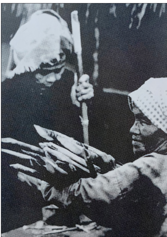
Những mũi chông của các má ở ba xã tây nam Bến Cát góp phần cùng con em chiến đấu bảo vệ xóm làng năm 1969