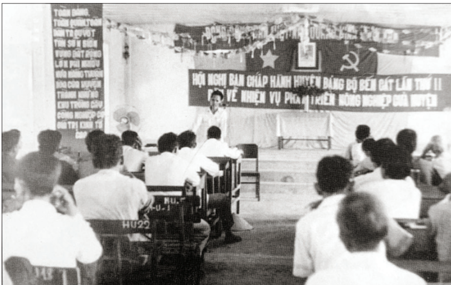
Hội nghị Ban Chấp hành Đảng bộ huyện Bến Cát lần thứ 2 bàn về nhiệm vụ phát triển nông nghiệp, tháng 8/1979