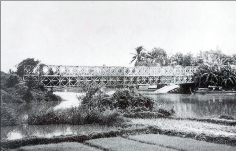
Cầu Đò (Bến Cát) - nơi thực dân Pháp đã chặt đầu hàng nghìn cán bộ cách mạng và người dân vô tội xung quanh thị trấn Bến Cát