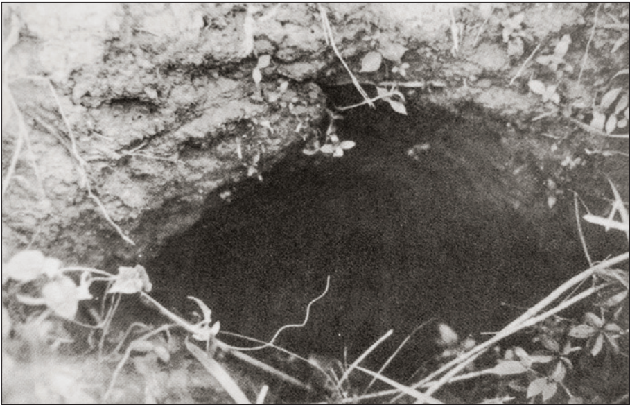
Cửa xuống địa đạo ba xã tây nam Bến Cát