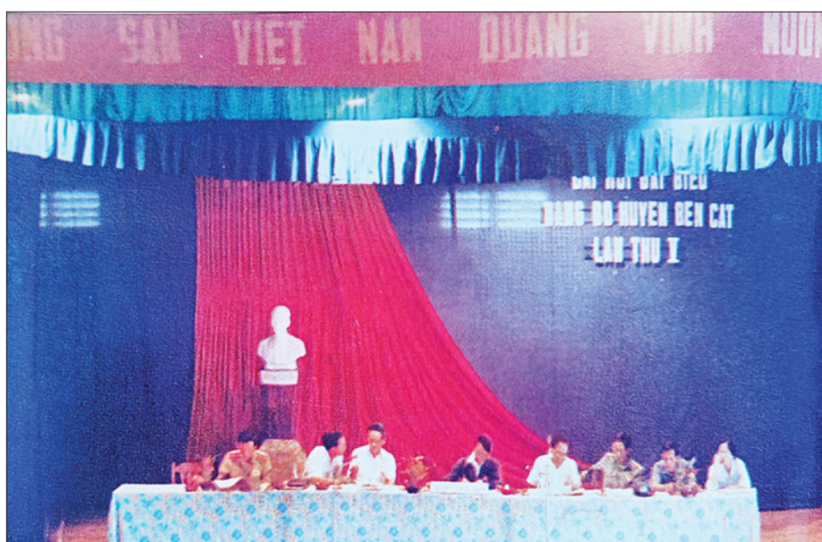
Đại hội đại biểu Đảng bộ huyện Bến Cát lần thứ V, nhiệm kỳ 1989 - 1991