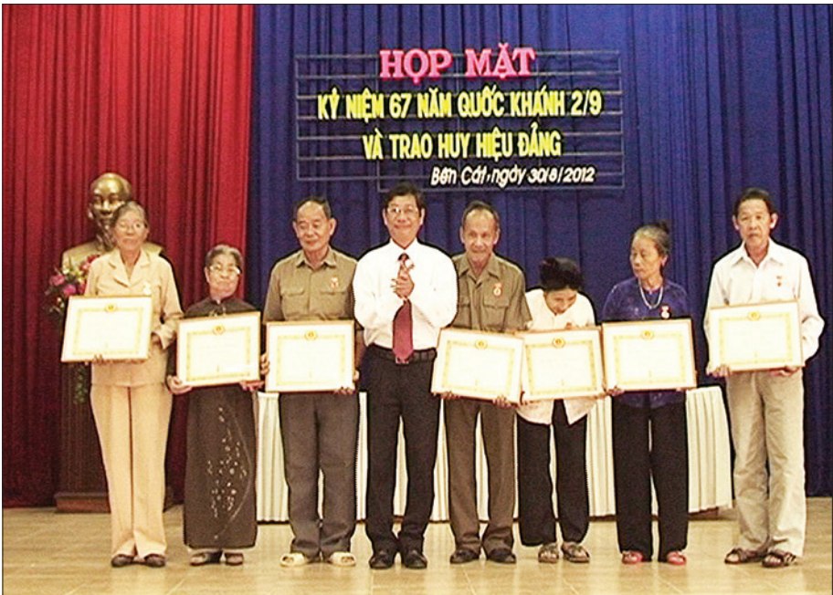
Đồng chí Nguyễn Hữu Chí – Phó Bí thư, Chủ tịch Ủy ban nhân dân huyện Bến Cát trao tặng Huy hiệu 50 năm tuổi Đảng cho các đảng viên