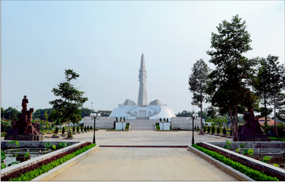
Tượng đài tại Khu di tích lịch sử địa đạo Tam giác sắt (được Bộ Văn hóa - Thông tin công nhận là Di tích lịch sử cấp Quốc gia vào ngày 18/3/1996; năm 2004 được trùng tu tôn tạo, có tổng diện tích 230.000m 2 )