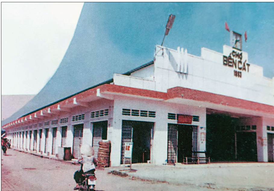
Chợ Bến Cát được xây dựng mới (khánh thành năm 1993)