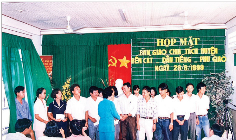
Họp mặt bàn giao chia tách huyện Bến Cát - Dầu Tiếng - Phú Giáo, ngày 28/8/1999