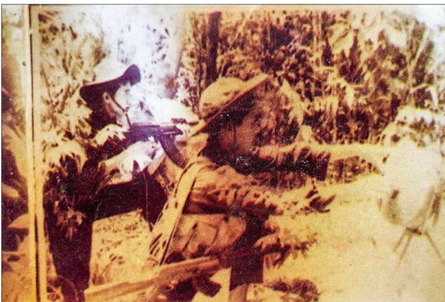
Du kích Bến Cát dùng DH10 tự chế từ những trái bom lếp của Mỹ để đánh Mỹ