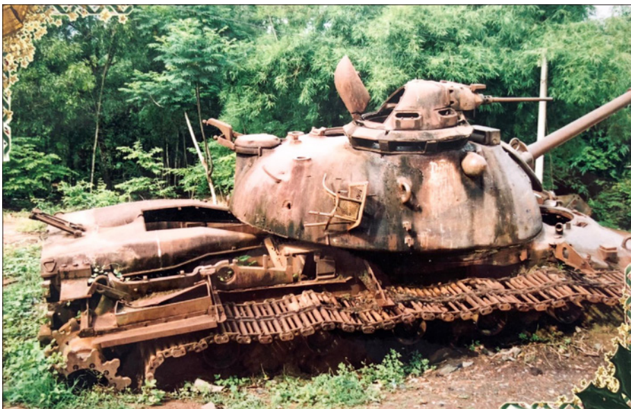
Xe tăng Mỹ bị quân và dân xã Phú An bắn cháy trong chiến dịch đánh địch lấn chiếm chiến trường Tây Nam - Bến Cát, mùa mưa năm 1974