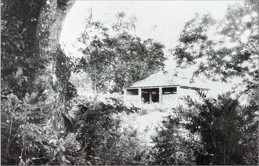
Đình Bến Tranh và gốc cổ thụ trước đình - nơi ông Tù của Đình và nhân dân lập miếu thờ cán bộ cách mạng và những người dân bị địch giết chết