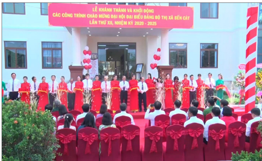
Lễ khánh thành trụ sở Thị ủy Bến Cát – một trong những công trình trọng điểm chào mừng Đại hội Đảng bộ thị xã Bến Cát nhiệm kỳ 2020 - 2025