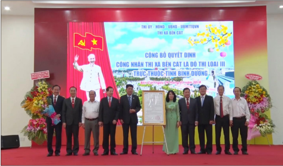
Thị xã Bến Cát được công nhận là đô thị loại III trực thuộc tỉnh Bình Dương năm 2019