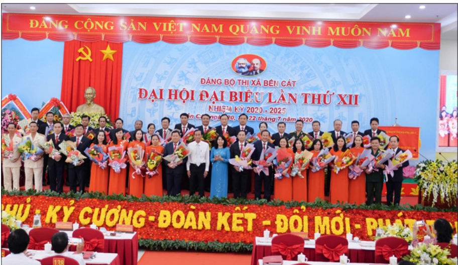
Ban Chấp hành Đảng bộ thị xã Bến Cát nhiệm kỳ 2020 - 2025