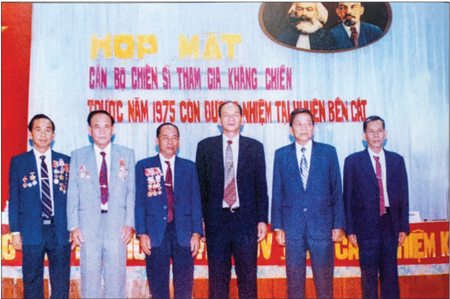
Các đồng chí Bí thư Huyện ủy huyện Bến Cát về dự họp mặt truyền thống cán bộ, chiến sĩ tham gia kháng chiến