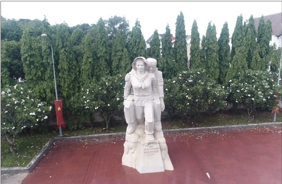
Tượng đài Anh hùng Lực lượng vũ trang nhân dân Đoàn Thị Liên (được đặt tại Công viên Đoàn Thị Liên – phường Chánh Phú Hòa, khánh thành ngày 10/7/2010)