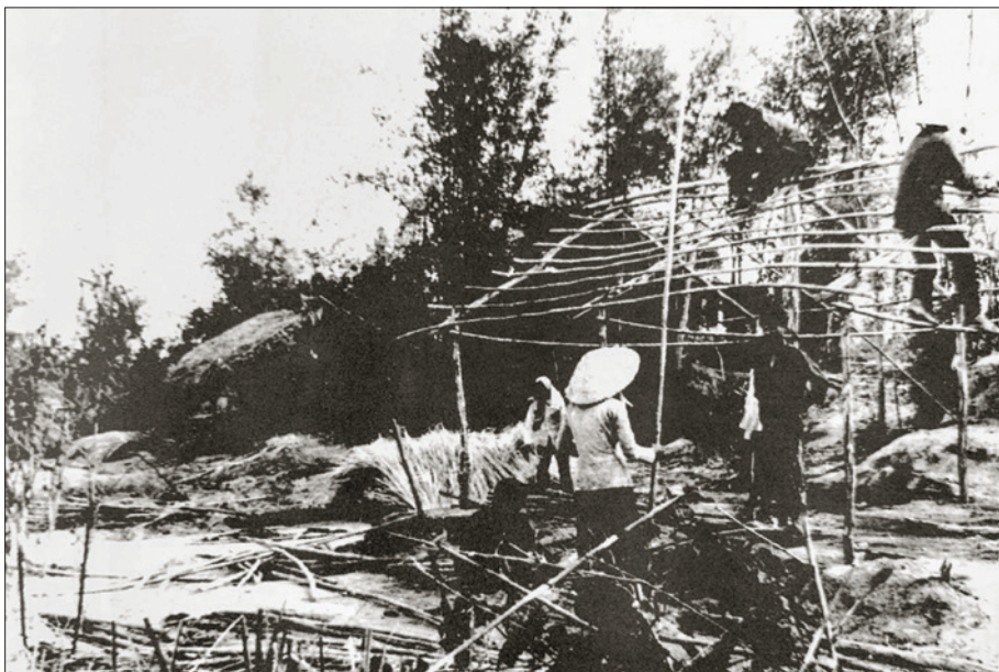
Đồng bào Nam Bến Cát trở về quê cũ cất lại nhà cửa sau thắng lợi của phong trào đánh phá ấp chiến lược năm 1965 - 1966