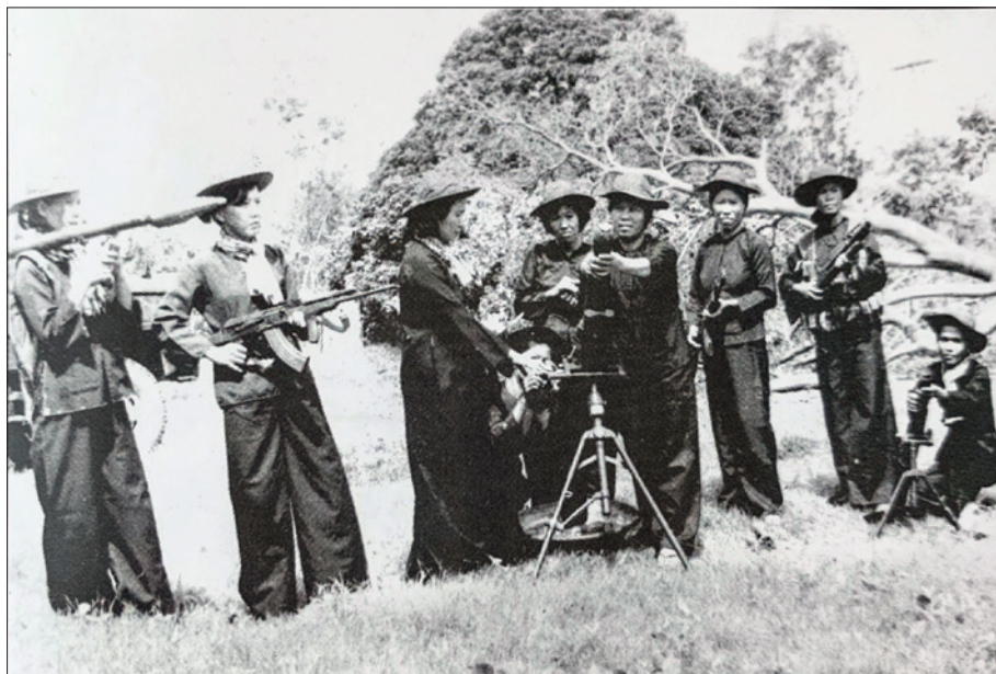
Đại đội nữ vũ trang C5 huyện Bến Cát