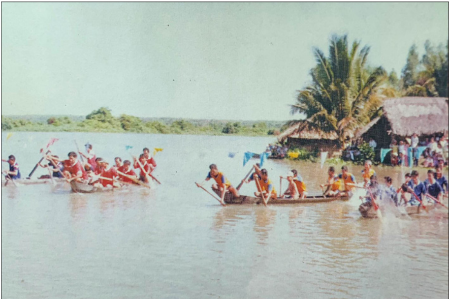
Giải đua thuyền huyện Bến Cát năm 1997