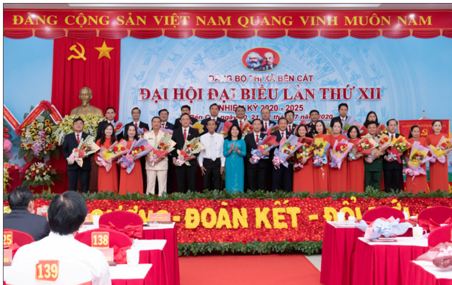
Đoàn đại biểu Đảng bộ thị xã Bến Cát tham dự Đại hội Đảng bộ tỉnh Bình Dương lần thứ XII