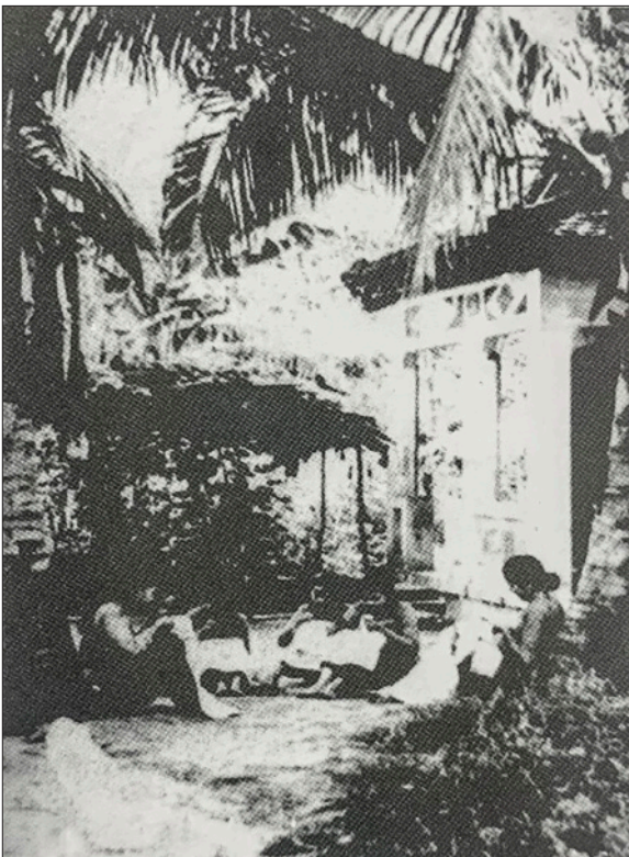
Vùng giải phóng ở Bến Cát được mở rộng, các chị em phụ nữ ba xã tây nam Bến Cát thêu khăn tặng chiến sĩ, năm 1965