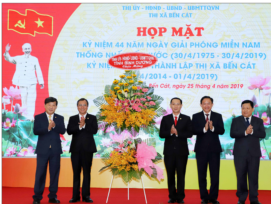
Lãnh đạo Tỉnh ủy Bình Dương tặng hoa chúc mừng tại buổi họp mặt nhân kỷ niệm 43 năm Ngày giải phóng miền Nam, thống nhất đất nước; kỷ niệm 5 năm thành lập thị xã Bến Cát năm 2019