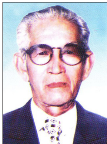
Đồng chí Diệp Hài Bí thư Huyện ủy Bến Cát (7/1954 - 5/1955)