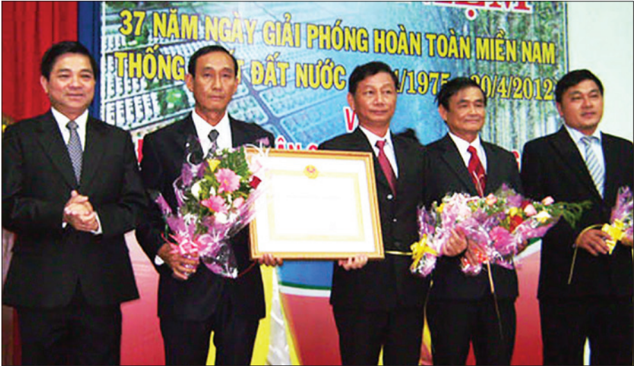
Họp mặt kỷ niệm 37 năm Ngày giải phóng hoàn toàn miền Nam thống nhất đất nước (30/4/1975 - 30/4/2012), huyện Bến Cát vinh dự đón nhận Huân chương Lao động hạng Ba của Chủ tịch nước