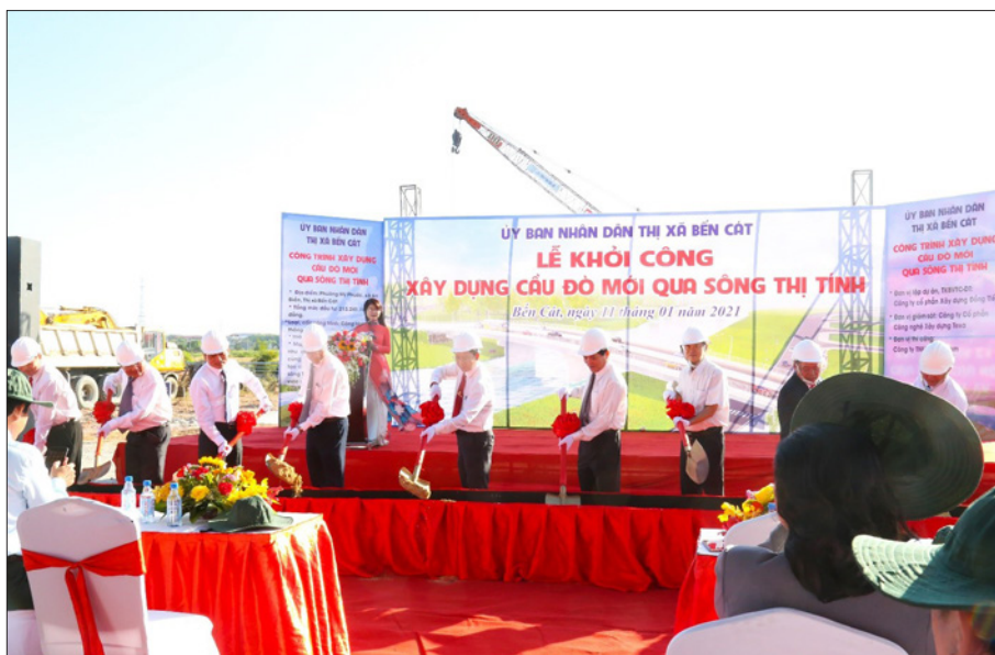
Lễ khởi công xây dựng Cầu Đò mới qua sông Thị Tinh năm 2021