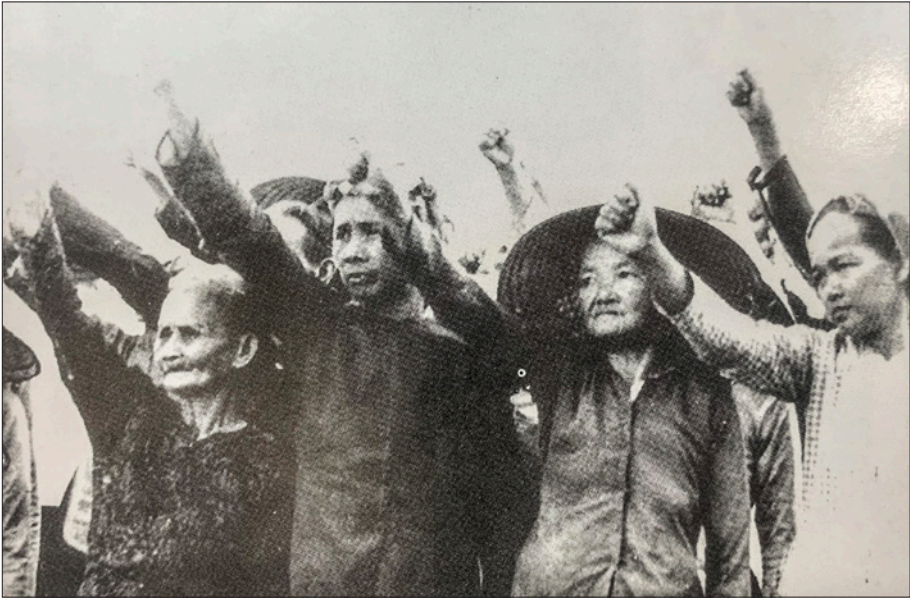
Phong trào đấu tranh chính trị chống gom dân lập ấp chiến lược của địch của các má ở ba xã tây nam Bến Cát