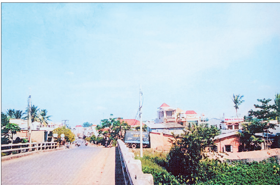
Cầu Đò Bến Cát được xây dựng mới năm 1993 với trọng tải 30 tấn