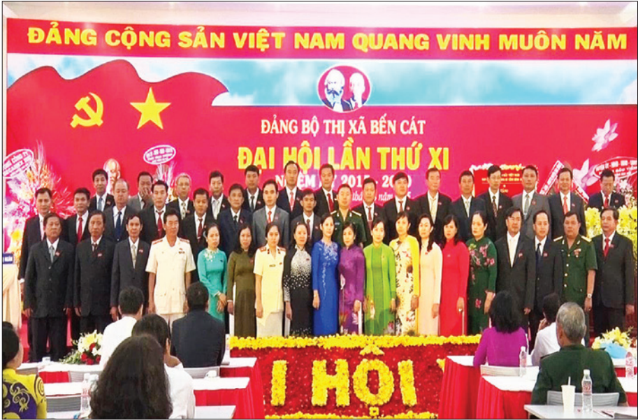
Ban Chấp hành Đảng bộ thị xã Bến Cát nhiệm kỳ 2015 - 2020