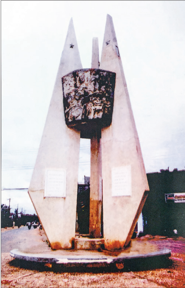
Bia chiến thắng tại thị trấn Mỹ Phước (Bia được xây dựng năm 1988; trước năm 1975, vị trí này được nhân dân gọi là Tàng Dù. Nơi đây, hàng trăm cán bộ, chiến sĩ cách mạng đã bị địch giết để khủng bố tinh thần nhân dân)