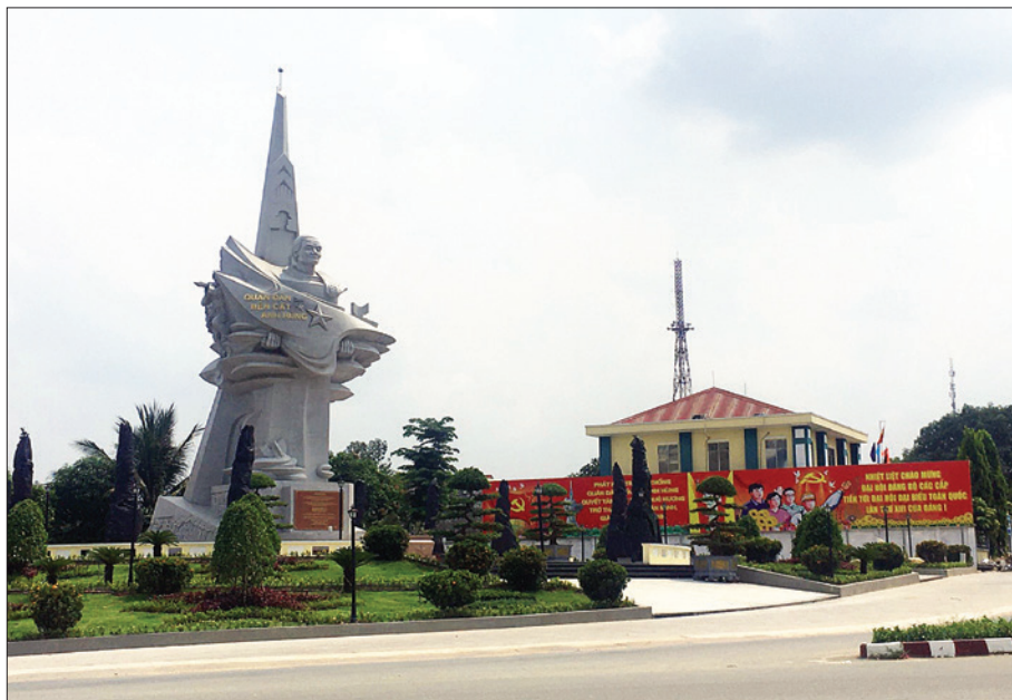
Công trình Tượng đài Bến Cát chào mừng Đại hội Đảng bộ thị xã Bến Cát nhiệm kỳ 2020 - 2025