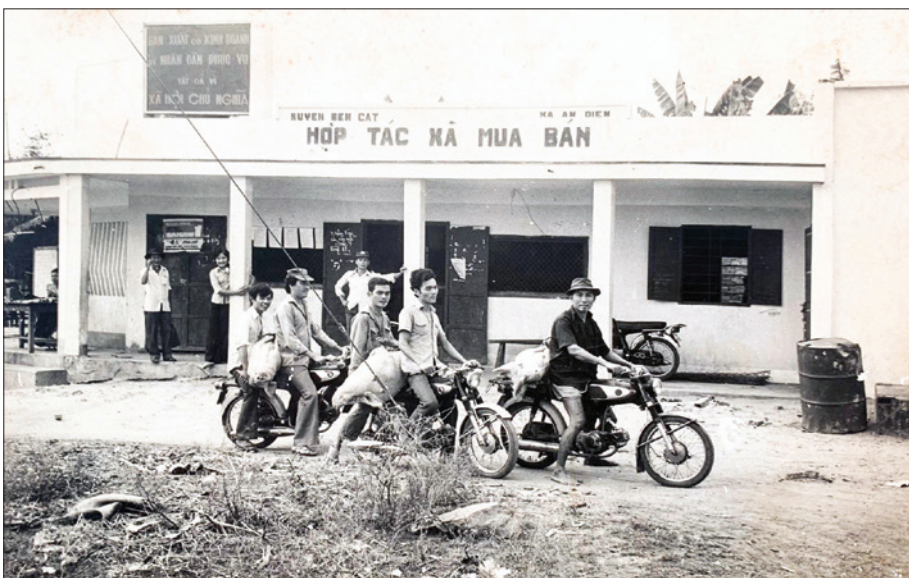
Hợp tác xã mua bán xã An Điền được ngành thương nghiệp tỉnh công nhận là lá cờ đầu trong các hợp tác xã mua bán của tỉnh