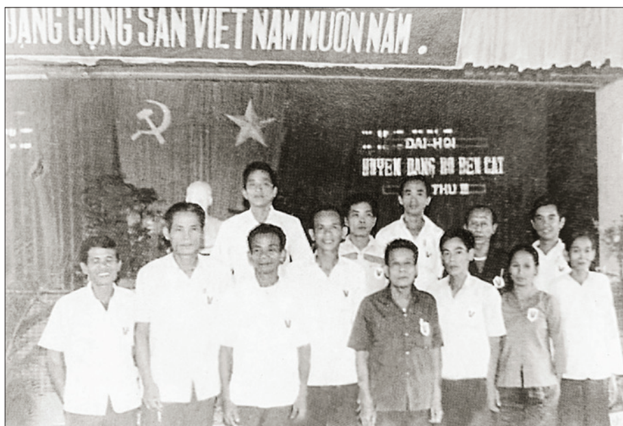
Đại hội đại biểu Đảng bộ huyện Bến Cát lần thứ III, nhiệm kỳ 1983 - 1986