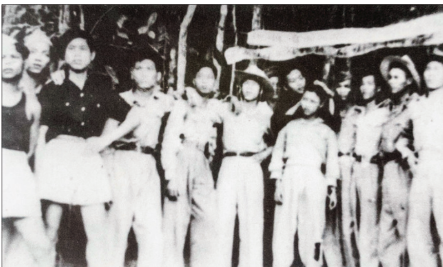
Đại đội 902 trước giờ xuất kích trong chiến dịch Lê Hồng Phong - Bến Cát (1950)