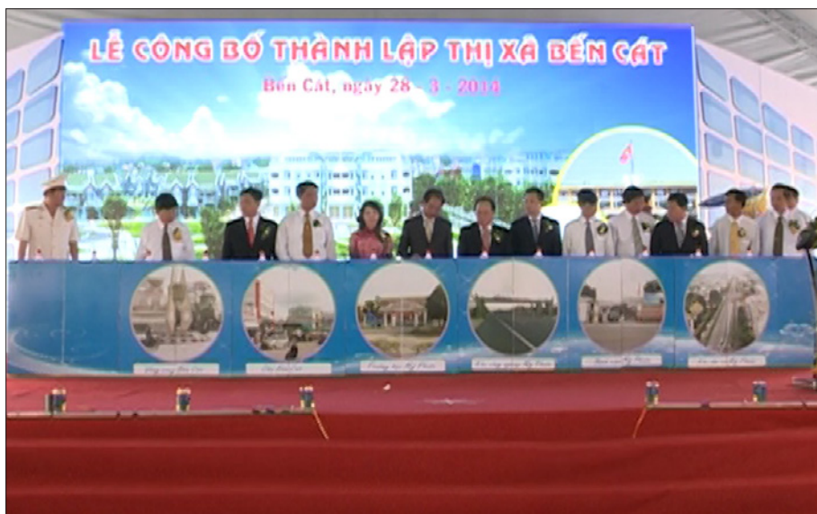
Thị xã Bến Cát long trọng tổ chức Lễ công bố quyết định thành lập thị xã theo Nghị quyết số 136/NQ-CP của Chính phủ