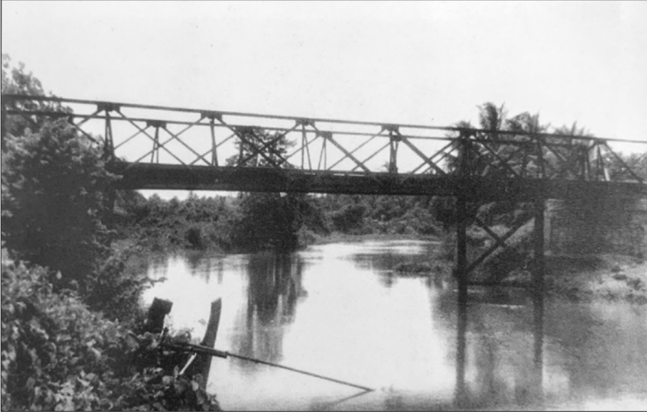
Cầu Quan (Bến Cát) - nơi thực dân Pháp giết hại đồng bào, chiến sĩ cách mạng và nhiều người vô tội những năm 1947 - 1948