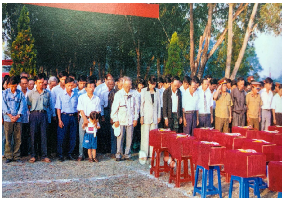
Huyện ủy, Ủy ban nhân dân, Ủy ban Mặt trận Tổ quốc Việt Nam và các ban, ngành, đoàn thể, học sinh huyện Bến Cát dự lễ truy điệu 65 hài cốt liệt sĩ các đơn vị C61, C5, năm 1998