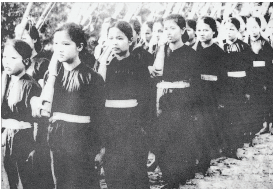
Đội nữ du kích Bến Cát thành lập năm 1949