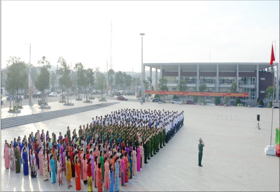
Một buổi chào cờ của lãnh đạo, cán bộ, công chức, viên chức thị xã tại Quảng trường 30/4, thị xã Bến Cát