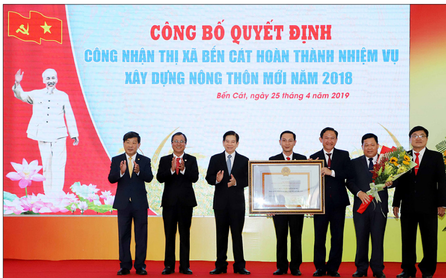
Thị xã Bến Cát được công nhận hoàn thành nhiệm vụ xây dựng Nông thôn mới năm 2018